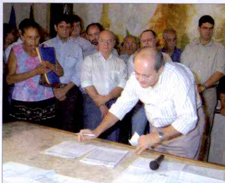
Prefeito Sílvio Mendes: um dos objetivos é fazer com que as pessoas voltem a circular pelo centro de Teresina

Os projetos complementares da obra incluem a instalações elétricas, hidro-sanitárias, de combate a incêndio, cálculos estruturais, sistemas contra danos ambientais, climatização e sonorização.