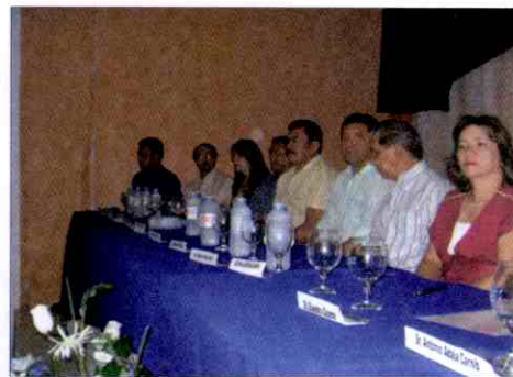
Solenidade contou com a presença de autoridades, empresários e presidentes das CDLs do interior